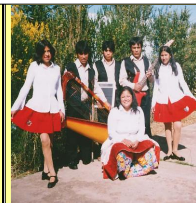
Puya Andina en Recreo Campestre Ahuac Chupaca Perú- 2008