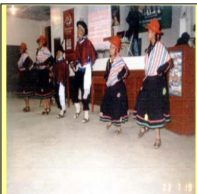
Elenco de Danza "Puya Andina" en Oroya Perú - 2004