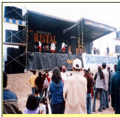
Feria Regional Cuasimodo Chilca Huancayo Perú - 2009